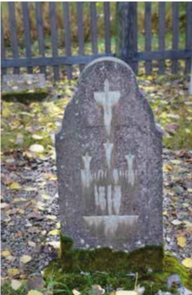
Grav 21, Heliodorus Materne.

han murade 1862–1863. Det kom att visa sig att det skulle gå åt en hel del dynamit för att riva skorstenen när den var uttjänt, men det är en annan historia.