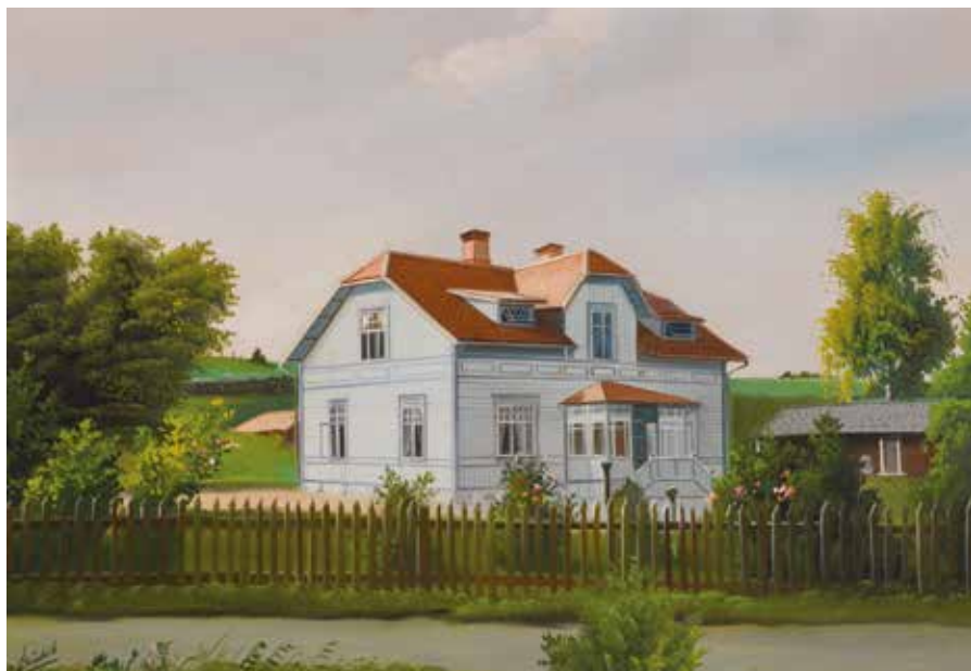
Bergsmansro. Tavlan återfinns på Knalla Gruvmuseum i Zinkgruvan.