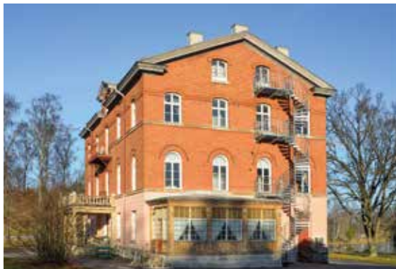
Casino i Åmmeberg byggdes 1860-1861 som samlingsplats för bolagets tjänstemän.

Den första begravningen på den katolska kyrkogården som omnämns i församlingsböckerna skedde i juli 1869. Innan dess har platsen använts för katolska begravningar, förmodligen så tidigt som 1865, det vill säga bara åtta år efter ankomsten av bolagets första tjänstemän till Åmmeberg. Den sista