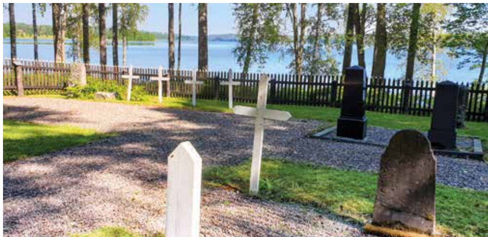
På den katolska kyrkogården begravdes traktens katoliker i åttio år. Den senaste begravningen skedde 1942.