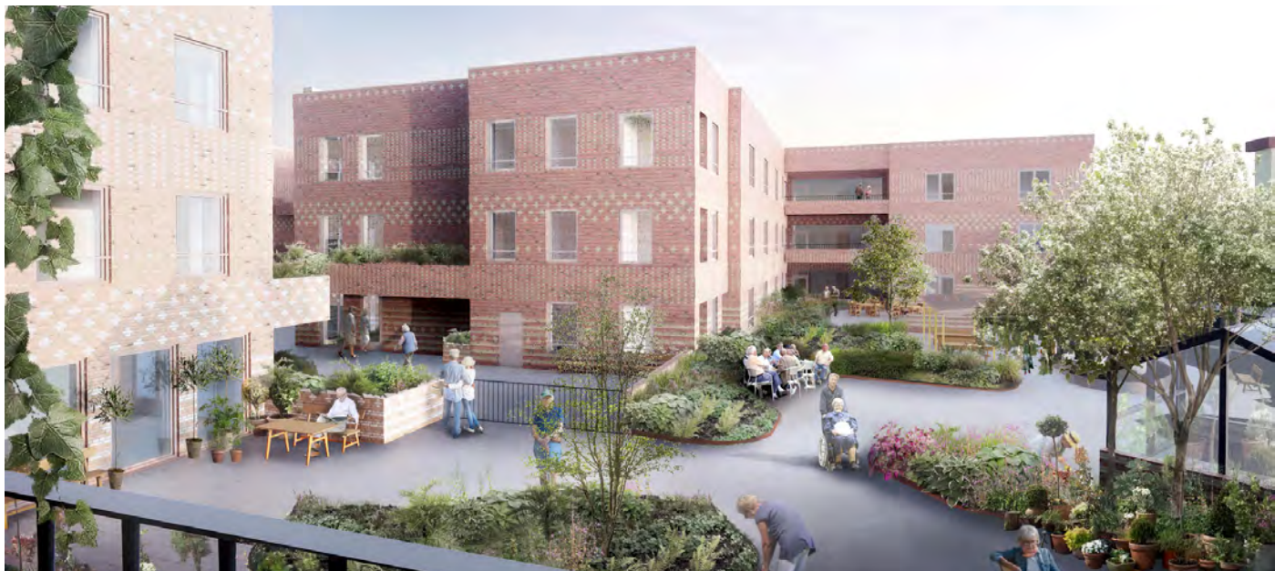
Illustration: Marge Arkitekter AB