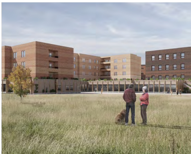
Illustration: Marge Arkitekter AB