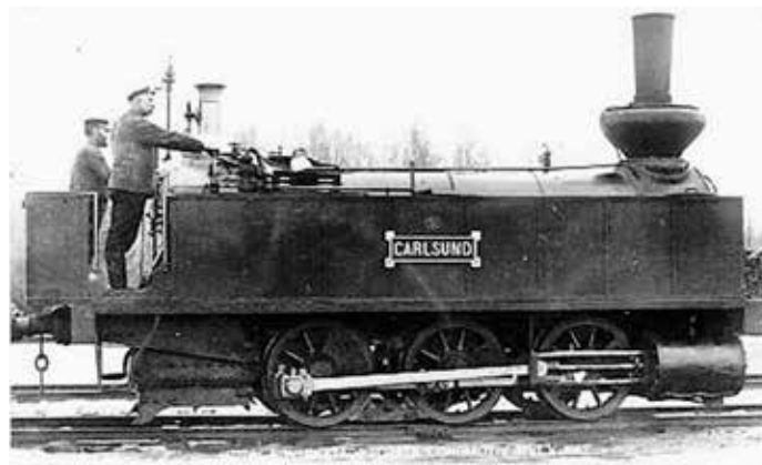
Företagets första lok. Tåget körde malm från Zinkgruvan till Åmmeberg. I andra riktningen kördes kol till Zinkgruvans ångdrivna maskiner.