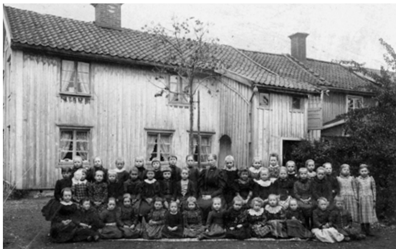
Drottning Lovisas flickskola, idag Lilla Bergsgatan 20A.