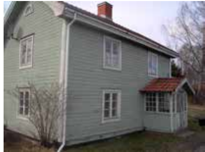
Moster Kristins skola, Åmmeberg.

Det sägs att skolan kom till efter att en gosse bett henne lära honom läsa. Första dagen kom fem och snart var de 30 elever. Föräldrarna betalade 25 öre/vecka. När elevantalet ökat till 55 flyttades undervisningen till ett större, dragigt och oisolerat utrymme. Undervisningen pågick mellan klockan 9 och 17. Verksamheten avslutades 1877–1878. Huset revs 2007.