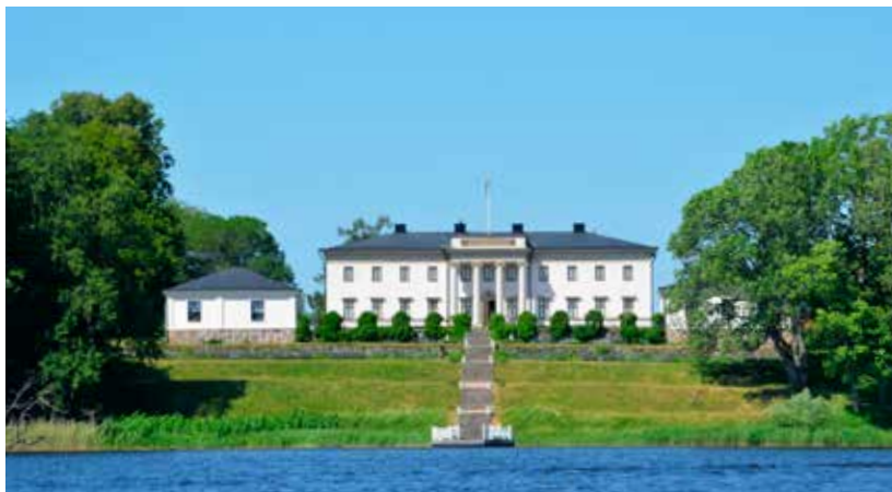
Stjersund.