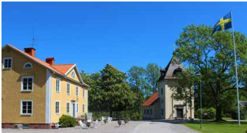
Olshammarsgården och Birgittakyrkan.