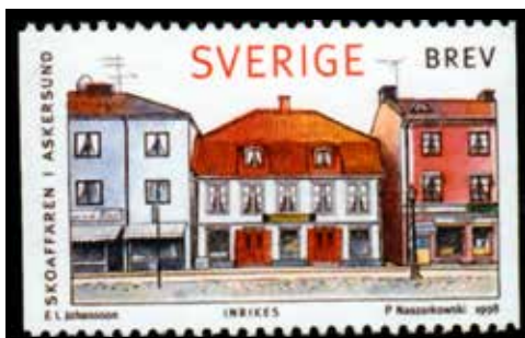
Huset som Café Tutingen ligger i uppmärksammades 1998 genom ett Sverigefrimärke i serien Svenska hus.