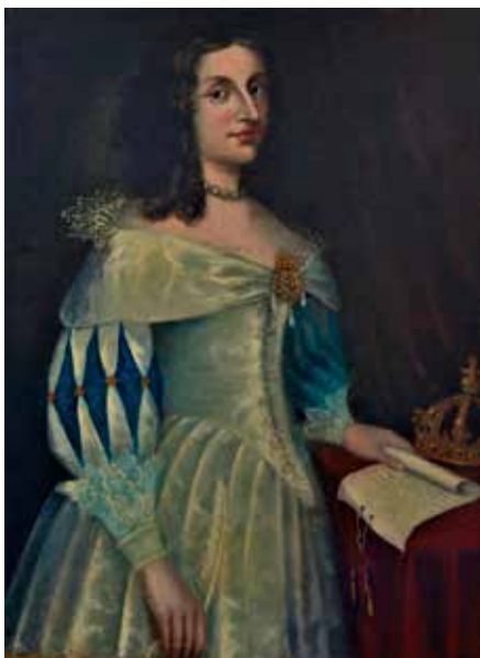
Tavla i Rådsalen i Askersund.