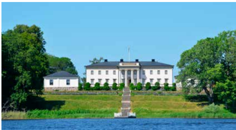
Stjersund.