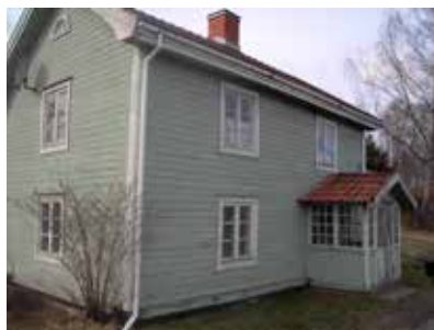
Moster Kristins skola, Åmmeberg.

Det sägs att skolan kom till efter att en gosse bett henne lära honom läsa. Första dagen kom fem och snart var de 30 elever. Föräldrarna betalade 25 öre/vecka. När elevantalet ökat till 55 flyttades undervisningen till ett större, dragigt och oisolerat utrymme. Undervisningen pågick mellan klockan 9 och 17. Verksamheten avslutades 1877–1878. Huset revs 2007.