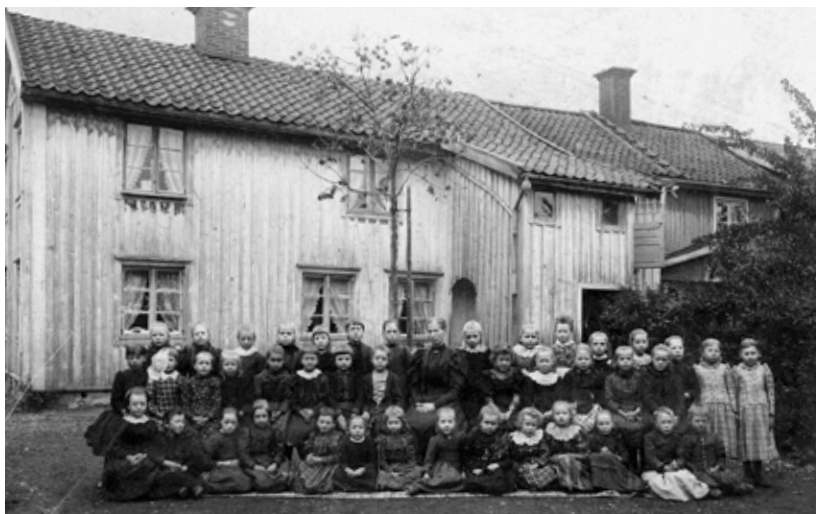
Drottning Lovisas flickskola, idag Lilla Bergsgatan 20A.