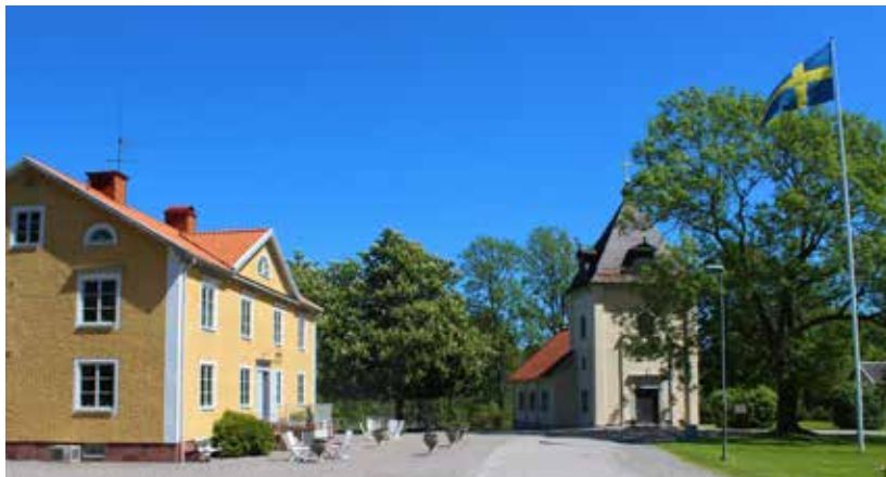
Olshammarsgården och Birgittakyrkan.